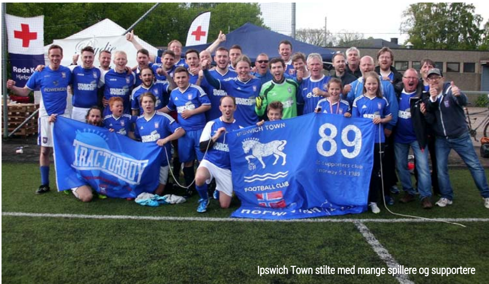
Ipswich Town stilte med mange spillere og supportere