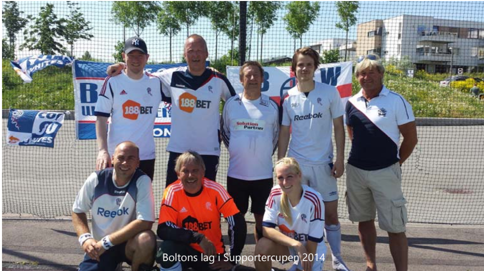
Boltons lag i Supportercupen 2014